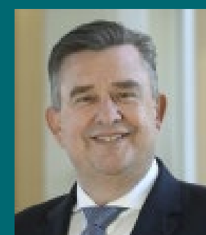
Voorzitter Emile Roemer